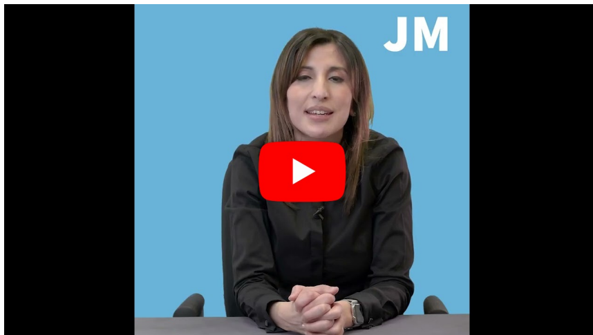
SOS Parents en détresse : La bronchiolite

Elles sont disponibles sur notre chaîne Medimotion et sur notre chaîne Youtube .